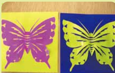
飛び出しそうな出来ですネ

完成ッ!!!!想像していたものよりも遙かに綺麗にできた☆蝶々☆に、とても感激されていました。