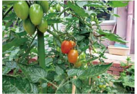
(のどかユニットのトマト)