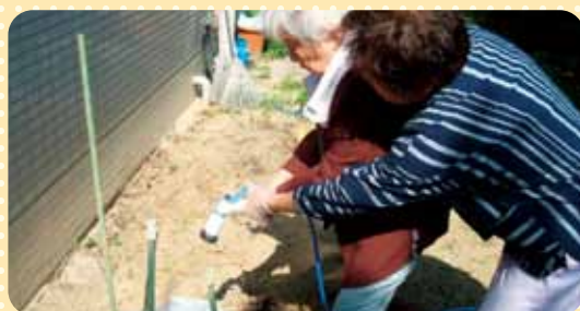
水も肥料もあげないとネ