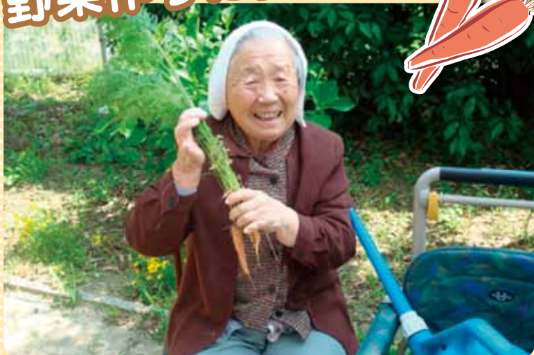
やすらぎ菜園で人参が採れました。次の収穫は何かな？