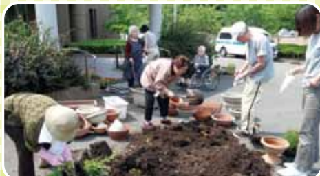
玄関前のプランターの植替えをしました。今年植木の剪定を入居者と飛び入りでご家族の方にも手伝っていただきました。