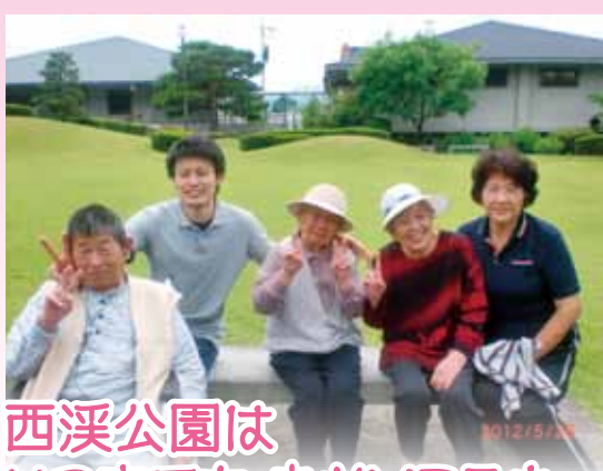
西溪公園は いつ来ても 良かところネ～