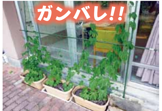
(いきいきユニットの緑のカーテン)