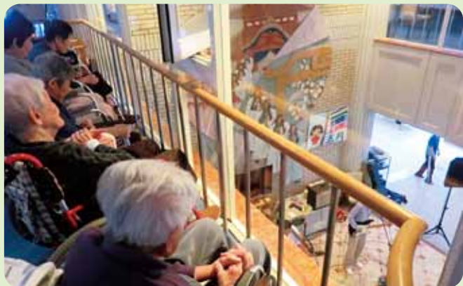
音楽を聞きつけて2階の皆さんも見物です ↑ 高見の見物？