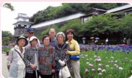
大村公園へバスハイク