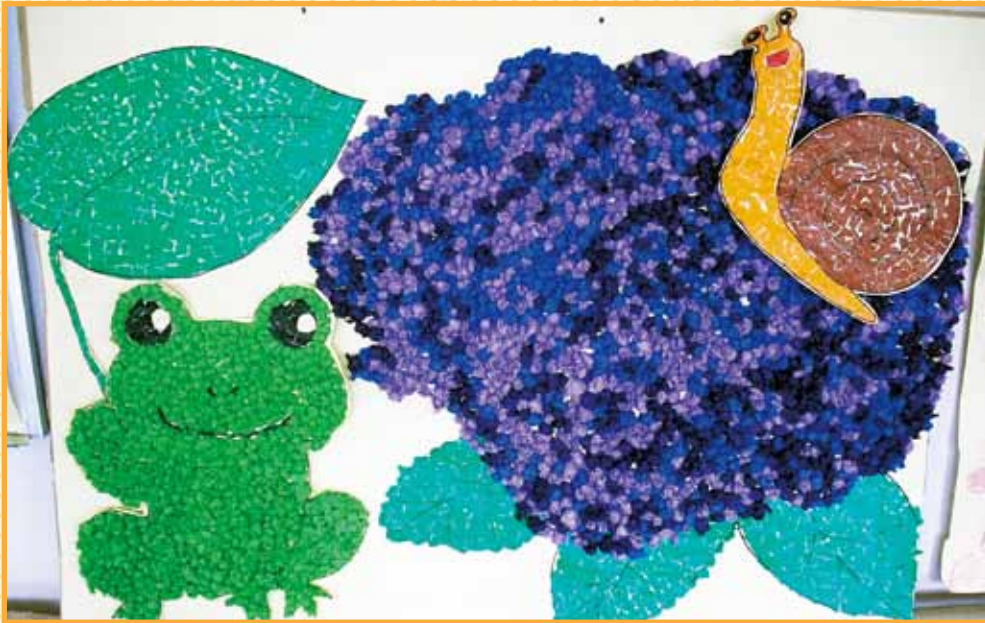
(紫陽花の貼り絵・天寿荘デイサービスの作品)