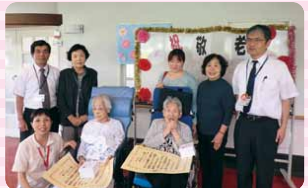
総理大臣からの100歳のお祝いにご家族も一緒にハイ・パチリ!