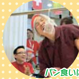
パン食いはこんな風に