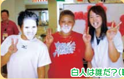
白人は誰だ?(職員による飴食い)