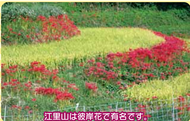
江里山は彼岸花で有名です。