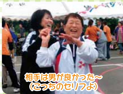
相手は男が良かった～ (ごうちのセリフよ)