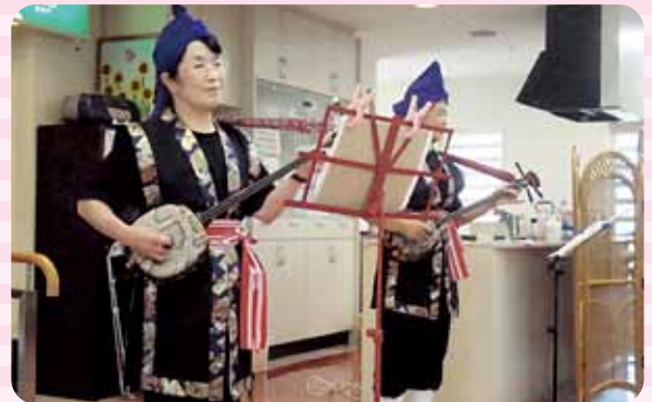
敬老会には伊万里から来て頂き大正琴と踊りを披露して下さいました。