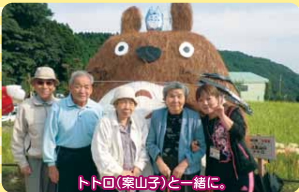
トトロ(案山子)と一緒に。