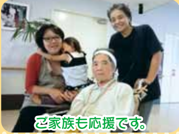
ご家族も応援です。