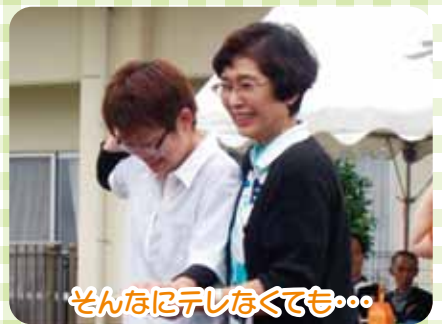
そんなにテレビなくても…