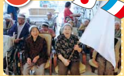
今年は赤組が勝利!