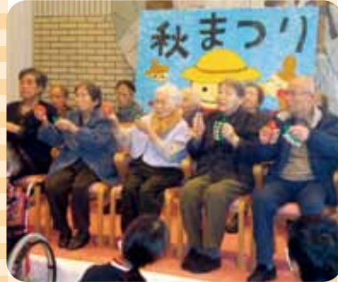
通所ご利用者による出し物