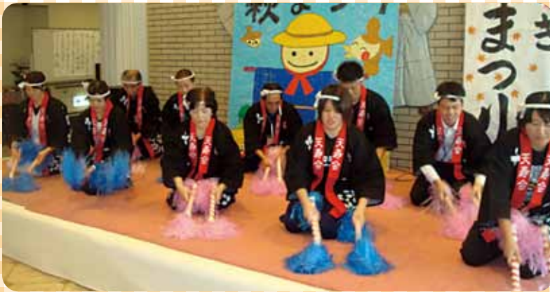
職員によるちゃんちきおけさ