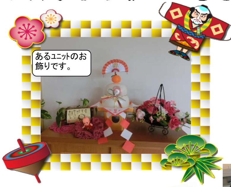
あるユニットのお飾りです。

平成25年がはじまりました。玄海園では元旦、ご利用者の皆さんにお屠蘇を召し上がってもらい新年をお祝いしました。今年もご利用者の皆さんによい年を過ごしてもらえよう、スタッフ一同お手伝いさせていただきます。