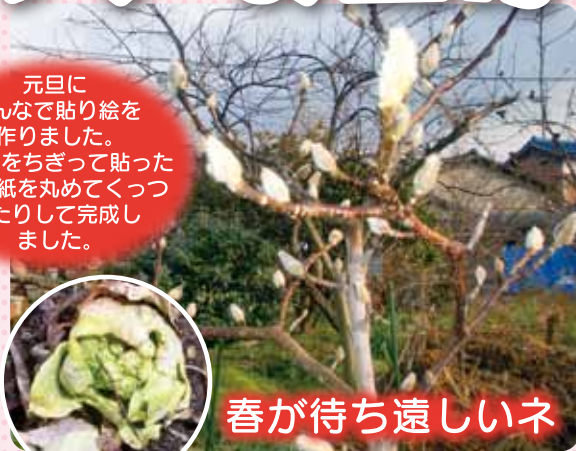
春が待ち遠しいネ

元旦に みんなで貼り絵を 作りました。 おり紙をちぎって貼った り、花紙を丸めてくっつ けたりして完成し ました。