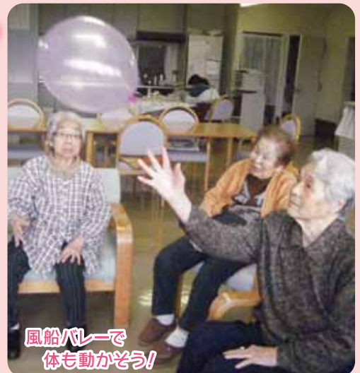
風船パレーで 体も動かそう!