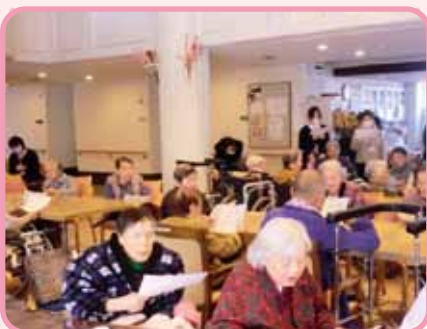
「1月1日」を歌いました