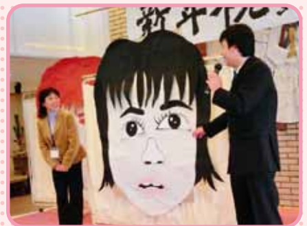
福笑いをしました(誰かにソックリ)