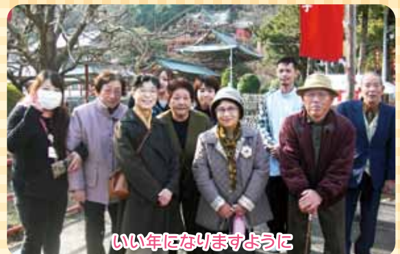
いい年になりますように