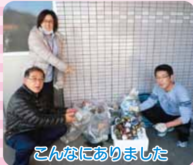
こんなにありました