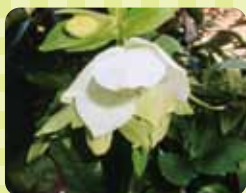
〈クリスマスローズ〉