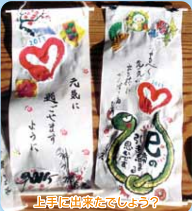
上手に出来たでしょう？