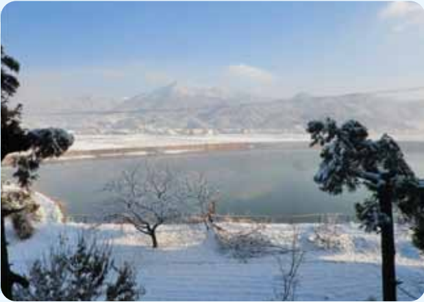
まるで外国の名所みたいですね