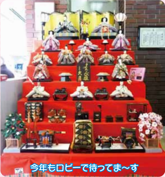
今年もロビーで待つてま〜す