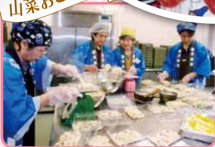
毎年同じ係で手慣れたものです。