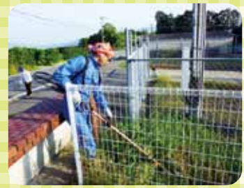
職員による 周辺道路の草刈りと缶拾い