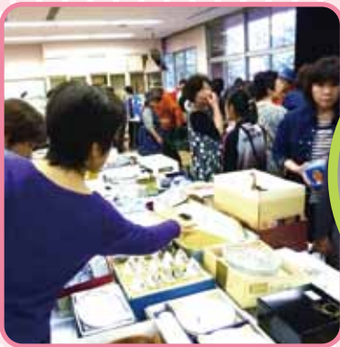
家にあってもつい 手が伸びる食器・食器