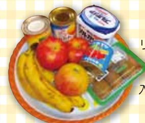
リンゴにバナ ナ、キウイ… 色んな物が 入りますね