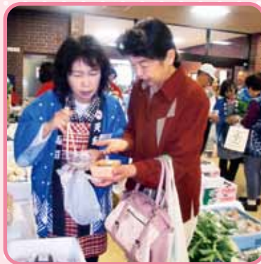
漬物食べてみらんですか。 おいしかですよ。