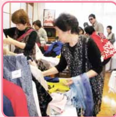
夏向きマフラーゲット! 他の色はないかな？