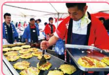
お好み焼き 毎回売れ筋No.1です。