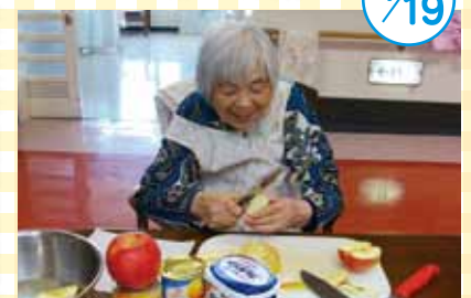
リンゴの皮むきは任せて!