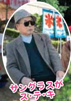
サングラスが ステキ