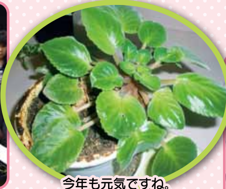
今年も元気ですね。 セントポーリア ナント10才以上です。 (天寿荘食堂にあります。)