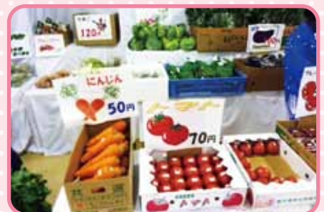
トマトの赤があざやか。 夏の予感。