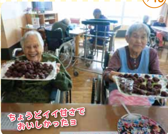
ちょうどイイ甘さで おいしかったヨ