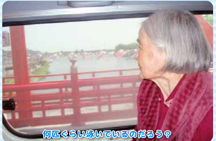
何匹くらい泳いでいるのだろう?