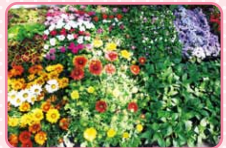
折しも外は雨模様で お花もイキイキしていました。