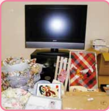
今年の目玉商品 テレビはもちろんセリで。