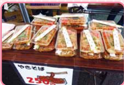
お腹一杯でも つい買ってしまふ、焼きそば!