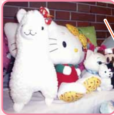
きっと私が一番に売れるワ (アルパカ)