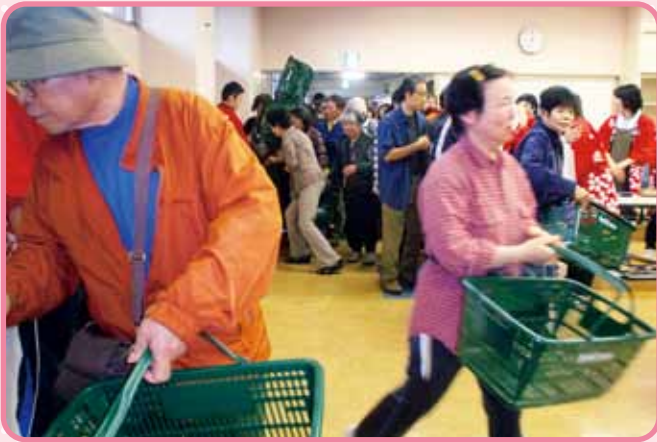
開場! めざす物はどこに?