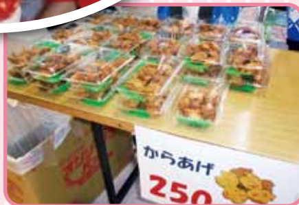
唐揚げがやわらかく おいしかったネ。