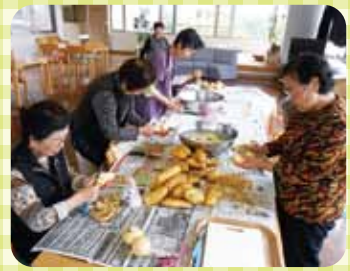
大地の皆さんによる カレー材料の下ごしらえ