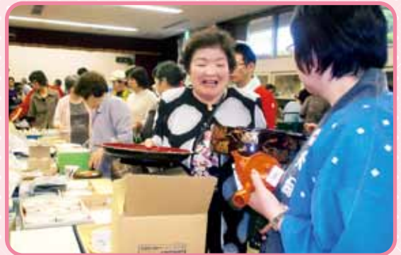
寿司などプレゼントする時 パックよりこっちが見映えが良からう？ 安かしネ。