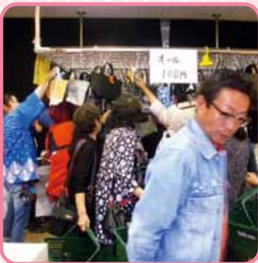
バッグはいくらでも 持とうらうが～