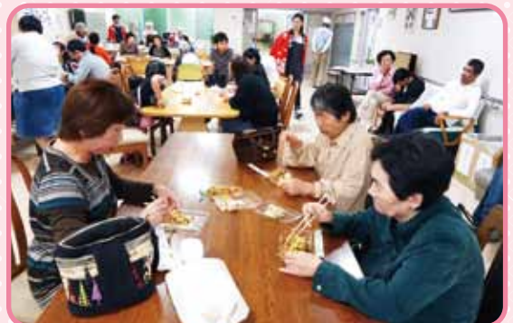
腹ごしらえには何を？