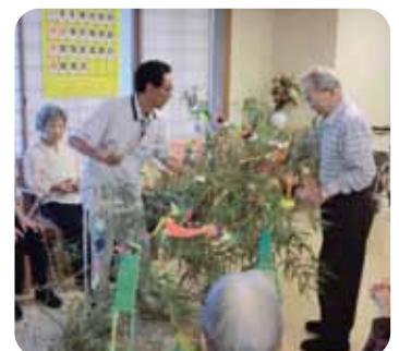
お願い事叶うといいですね