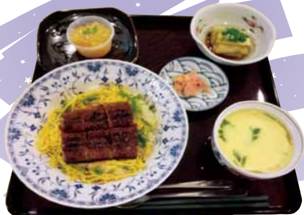
七夕ご膳はおいしかったヨ