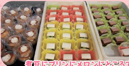
煮豆にプリンにメロンにとろろてん...どれを食べようか迷いそう!