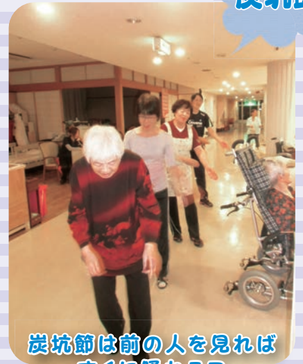
炭坑節は前の人を見れば すぐに踊れるヨ