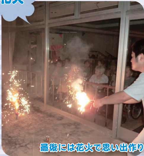
最後には花火で思い出作り