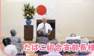
たばこ組合支部長様