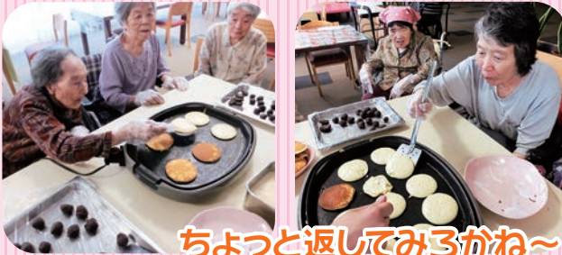
ちょっと返してみるかね～