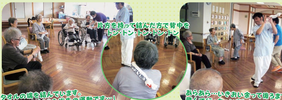
片方を持って結んだ方で背中を トシ・トシ・トシ・トシ

先日、デイサービス利用者様とグループホーム利用者様で交流会を行いました。午後からの活動でレクリエーションの際、グループホーム利用者様がお散歩されている所をお誘い一緒に歌に合わせた体験を行いました。