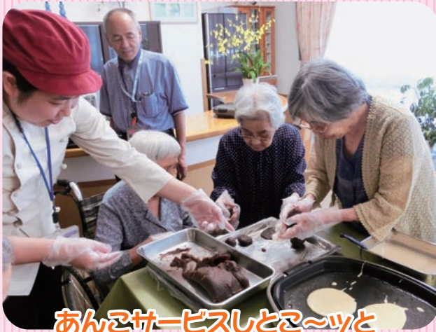
あんこサービスしとこ～ツと