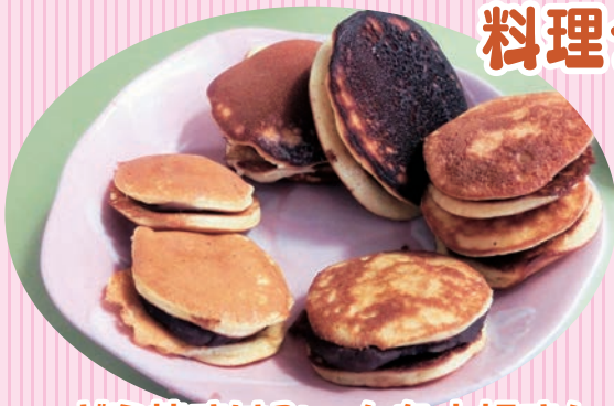
どら焼きはみ～んな大好き!