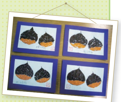
栗を貼り絵にしてみました