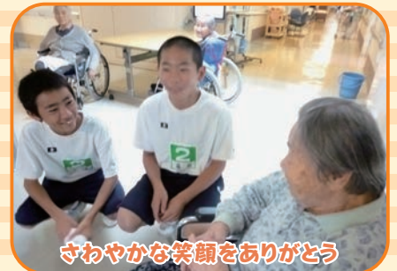
さわやかな笑顔をありがとう