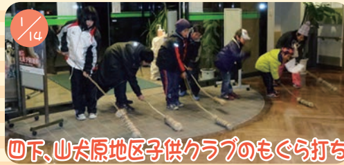
山下、山犬原地区子供クラブのもぐら打ち