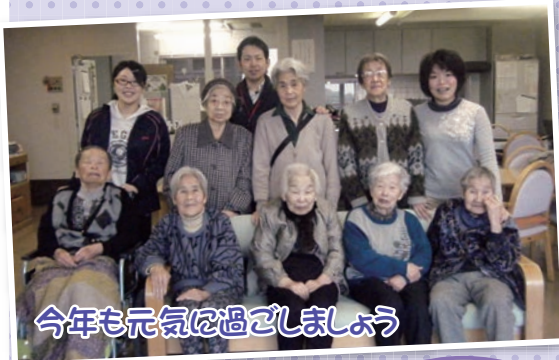
今年も元気を過ごしましょう