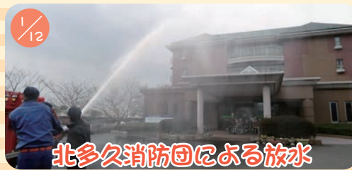
北多久消防団による放水