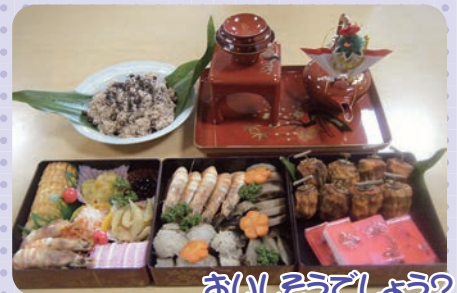
おいしそうでしょう?