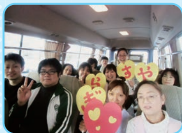
今まで色々な所へ連れて行ってってくれてありがとう