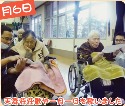
天寿荘荘歌や一月一日を歌いました