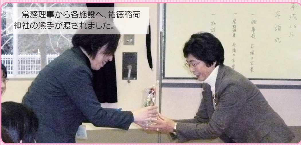
常務理事から各施設へ、祐徳稲荷 神社の熊手が渡されました。