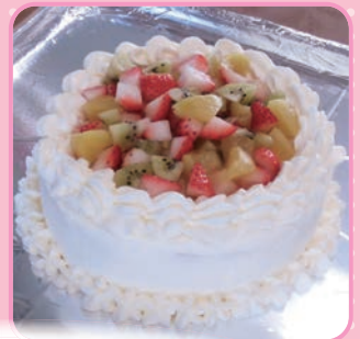
やっぱり手作りはおいしいネ