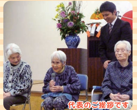
代表のご挨拶です