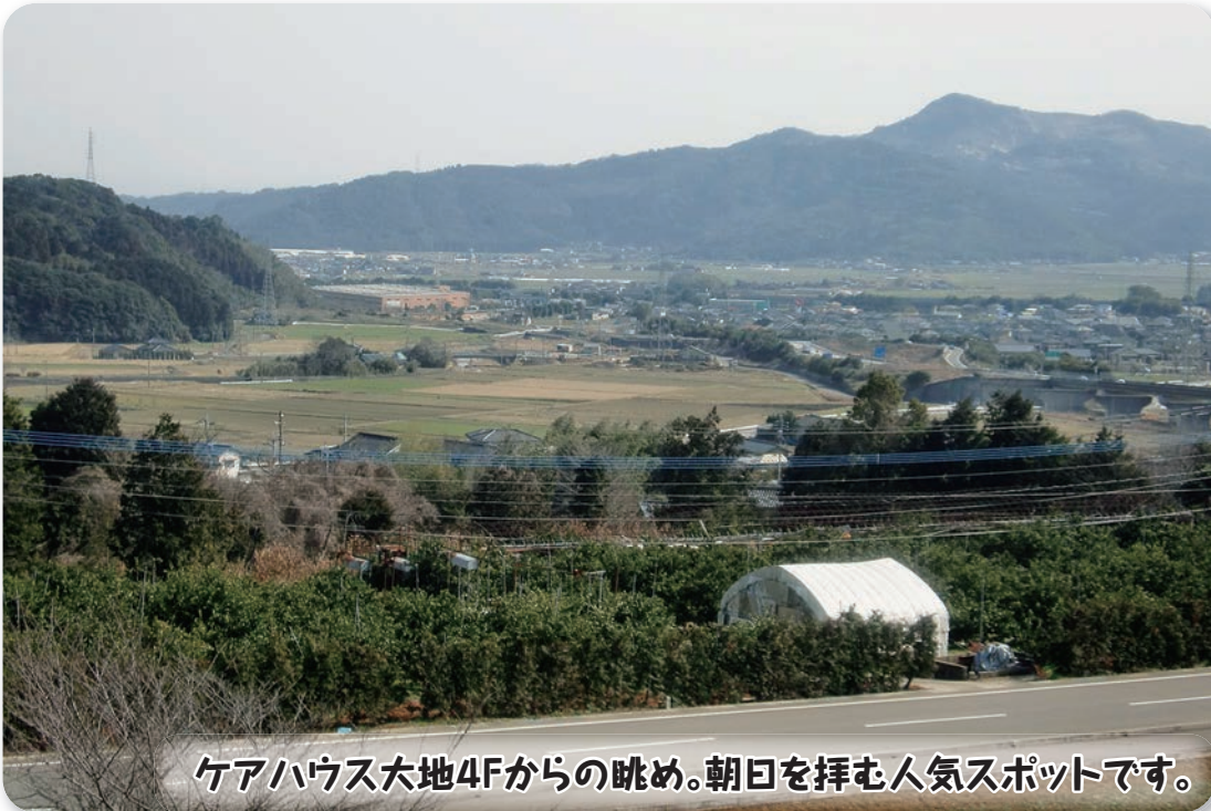
ケアハウス大地4Fからの眺め。朝日を拝む人気スポットです。