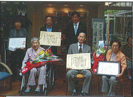
多久市長がお祝いの訪問に来られました。