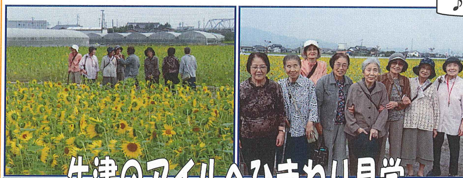
牛津のアイランドへひまわり見学