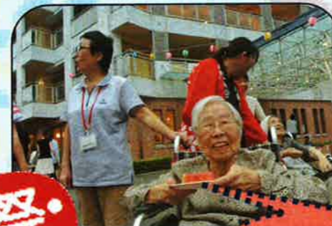
暑いけど、祭りは 楽しいですね☆