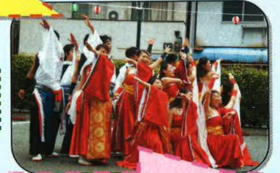
よさこいチーム「ENTRANCE」 に来て頂きました！！