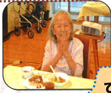
ここから見る事が できて幸せね。