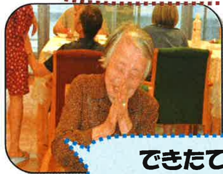
できたては、 すごく美味しい！

8月1日毎年恒例のバーベキューは、今年はいにくのお天気でした。その為室内を利用して行いましたが、大変盛り上がりました！！