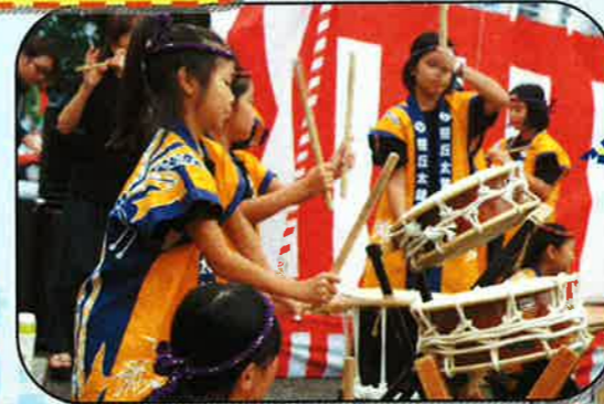
笹丘子供太鼓!! 迫力満点！