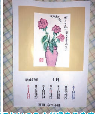
作品を見るといつも心が温まります