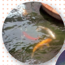
光る庭の金魚達が 可愛かったネ