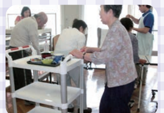
自分の分は持って行きます。