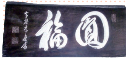
天寿荘開荘当初から飾られてました。 理事長作です