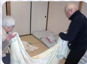
自分たちが使った布団などを片づけています。 協力しながら畳みます!!

今では「生活」に関連した内容を取り入れ計画行っています。食事も自分の分は自分で用意されています。布団やシーツ等も上手に畳めます。