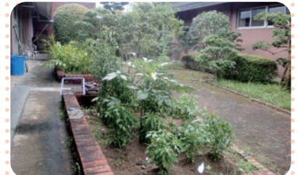
南棟のミニ菜園も豊作続きでした