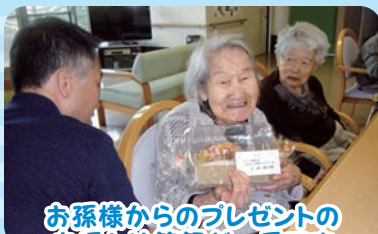
お孫様からのプレゼントのお返しは笑顔が一番です