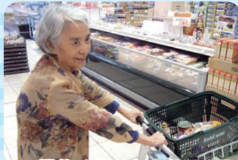
買物は昔からの楽しみ