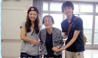
ご家族の訪問がなにより