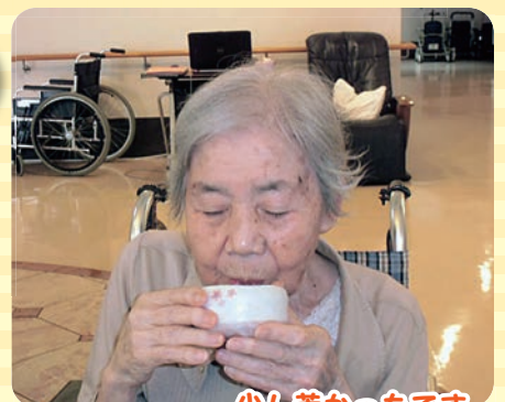
少し苦かったです