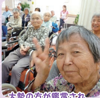
大勢の方が鑑賞され 賑わいました