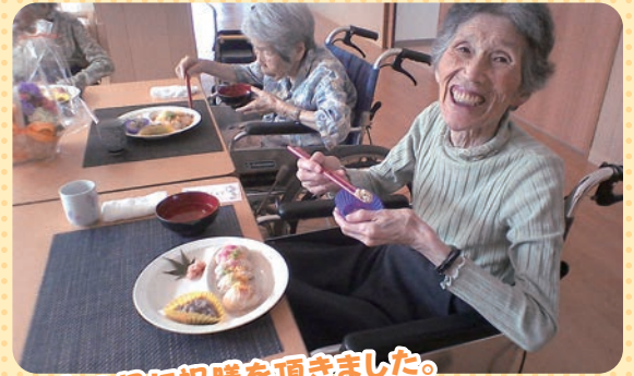
敬老の日に祝膳を頂きました。