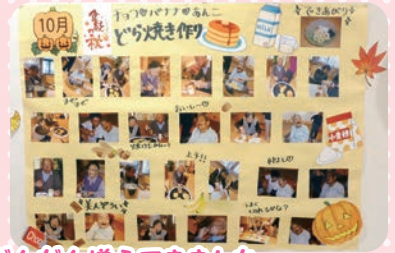
作品紹介の写真掲示がだんだん増えてきました