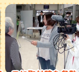
誰にも身近で大切なテーマに取材陣も多数！