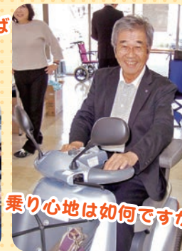
乗り心地は如何ですか？