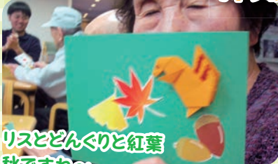
リスとどんぐりと紅葉 秋ですな〜