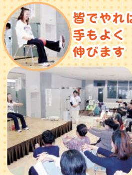
皆でやれば 手もよく 伸びます