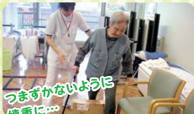
つまづかないように 慎重に...