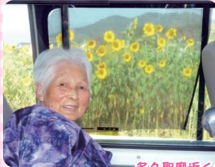
多久聖廟近くのひまわり畑へ