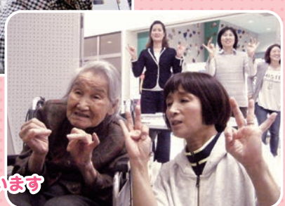
指遊びを習っています