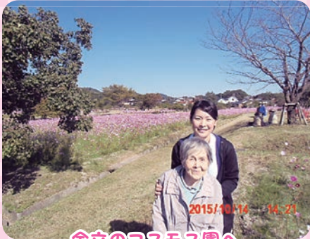
金立のコスモス園へ