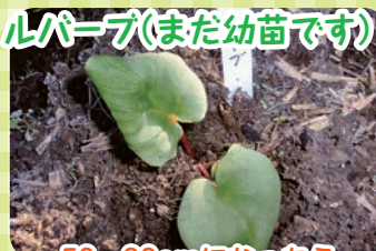
50~80cmになったら茎をジャムで