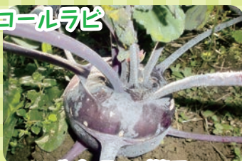
生食・スープ等で