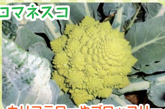
カリフラワーやブロッコリーと同じように