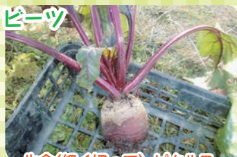
生食(細く切って)・ピクルス・ゆでてサラダに・ボルシチ等汁物に