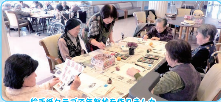
絵手紙クラブで年賀状を作りました