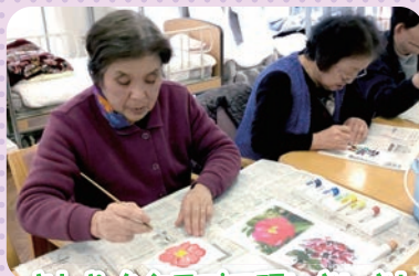
ざわやかクラブで頭いいき!