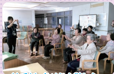
絵手紙・色ぬりも難しか〜