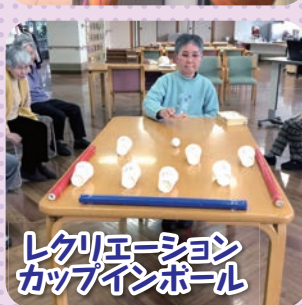
レクリエーション カップインボール