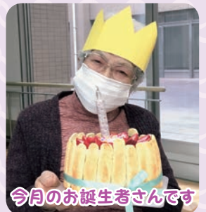
今月のお誕生者さんです