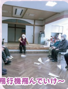
今年の抱負を乗せて飛行機飛んでいけ～