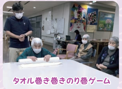
タオル巻き巻きのり巻ゲーム