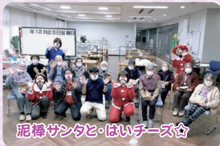
泥棒サンタと・はいチーズ☆