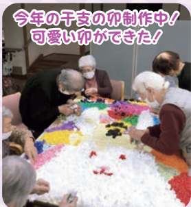
今年の干支の卯制作中! 可愛い卯ができた!