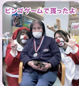
ビンゴゲームで買ったよ!