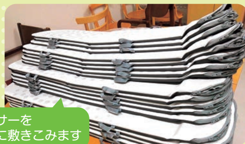
シート状のセンサーを マットレスの下に敷きこみます

1月下旬より国が推奨している見守り支援機器「眠りスキャン」22台を設置しました。心拍数や睡眠状態等がわかり異常の早期発見に繋がります。引き続き安心安全のサービス提供に努めて参ります。