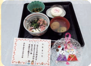
初めてのネギトロ丼は大好評でした