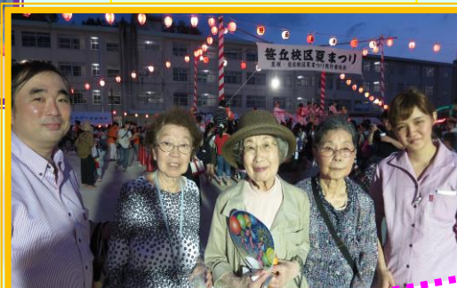
外で飲むビールは美味しいわ★