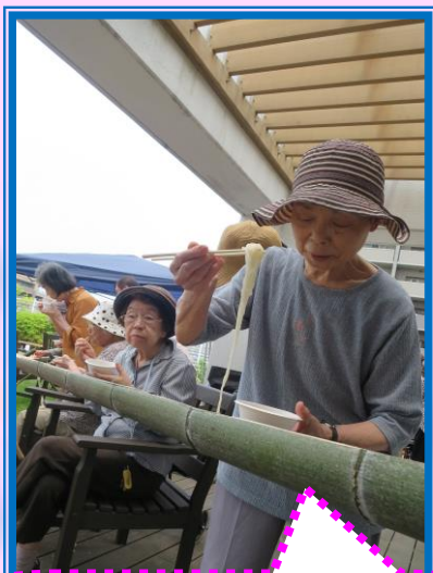
上手くつかめたわ♪