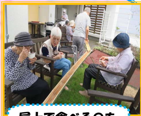
屋上で食べるのも 良いですね☆

屋上で流しそうめんを行いました！！ 竹の上を流れるそうめんは とても涼しげで、夏を感じる食事会と なりました。