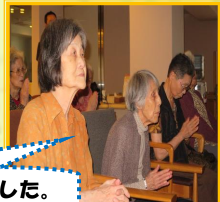
参拝気分になり、実際に手も合わせました。