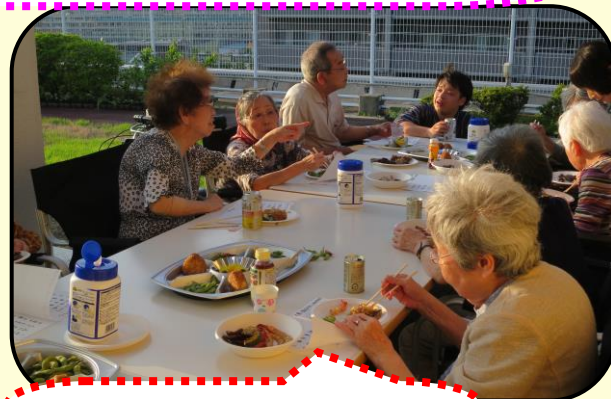
お酒も料理も美味しいですね！！