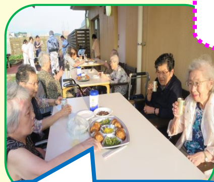
外で食べると一味違いますね♪

毎年恒例のバーベキュー。今年も大濠花火大会の日に合わせて実施しました。開放感のある食事と花火の鑑賞は何度行っても最高です！！